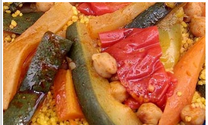
Couscous végétarien (semoule de blé + pois-chiches)

Il est frustrant de ne pas parler des Cytises, Arbre de Judée et autres Cassia tous si décoratifs. Mais les Papilionacées alimentaires sont un monde dont l'importance pour l'humanité est énorme. Au lieu de vanter les protéines apportées par des Insectes- c'est la nouvelle mode- il vaudrait mieux remettre en valeur toutes ces recettes légumineuses-céréales qui ont permis aux civilisations de se nourrir.