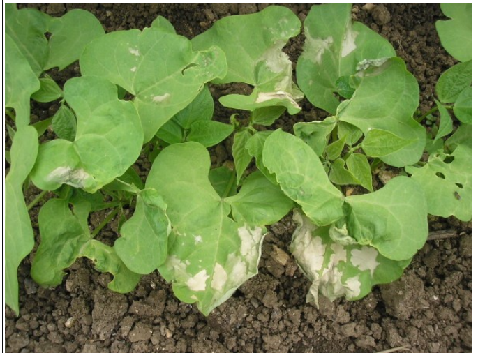
Mildiou sur haricots blancs

Oïdium, mildiou et anthracnose sont les maladies les plus fréquentes. Mais un arrosage limité et un apport d'azote réduit limitent ces maladies.