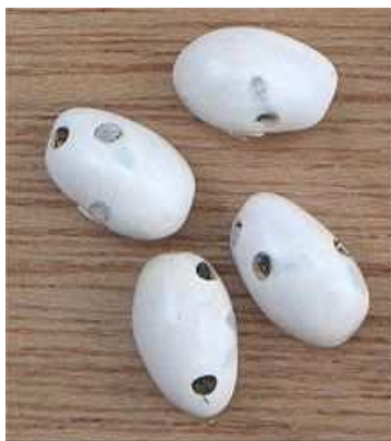
Haricots blancs charançonnés