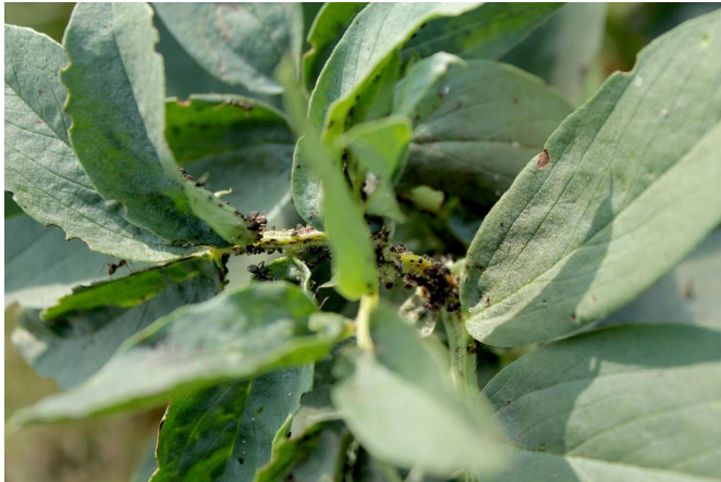
Pucerons sur fèves

n'aiment pas l'eau. Compléter avec une pulvérisation de soufre-poudre. Une pulvérisation de purin d'ortie est également efficace. Quant aux bruches et charançons qui rongent les graines stockées, surveillez vos stocks !