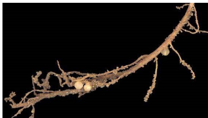
Nodosités sur racines

Une des caractéristiques de beaucoup de Fabacées est de pouvoir abriter dans des nodosités racinaires des bactéries Rhizobium fixatrices d'azote : toutes les espèces de la sous-famille des Papilionacées en abritent.