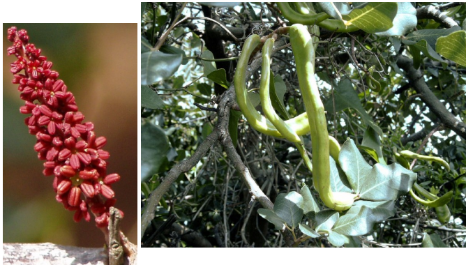
Fleurs et jeunes gousses de Ceratonia silica

Les Caesalpinacées , à fleur pseudopapilionacée dont le Flamboyant, le Caroubier ( Ceratonia silica ).