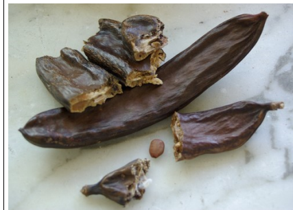
Gousse et graines de caroubier

L'ensemble de ces familles présente ses graines contenues dans une gousse, que l'on appelle en botanique un « légume ».