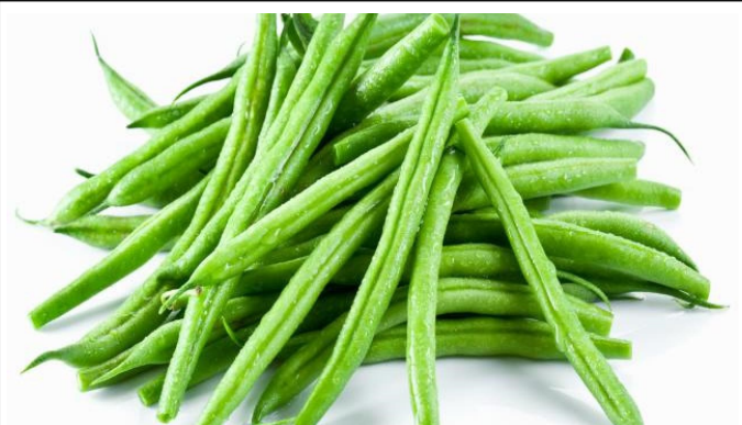
Gousses d'haricots verts

Est-ce que tous les légumes de la soupe sont bien des « Légumes » ?