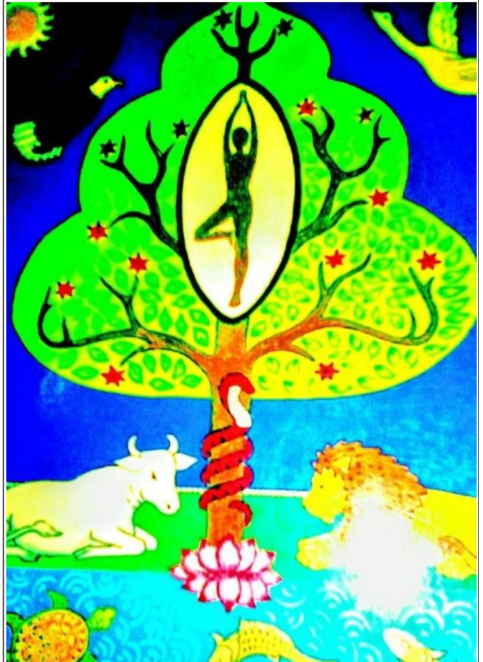
Arbre de vie et yoga

À feuilles caduques, il est ostensiblement symbole de cycle de vie, à feuilles dites « persistantes », il évoque subtilement l'éternité !!!